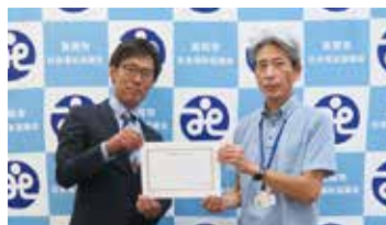
37. ダイナム栃木真岡店