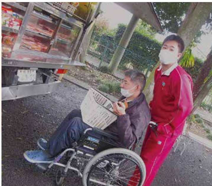
▲移動販売車にて買い物中