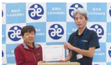
8. JAはが野 真岡地区二宮地区女性会(10月)