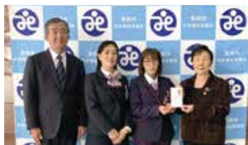
1. 古河ヤクルト販売株式会社