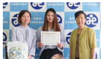
20. 明治安田生命 宇都宮支社真岡営業部