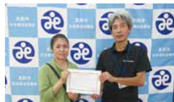
8. JAはが野 真岡地区二宮地区女性会(9月)