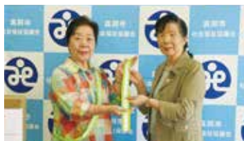
31. 真岡地区 交通安全協会女性部