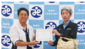
42. JAはが野 青壮年部