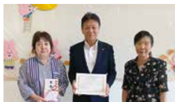
14. 真岡信用組合 他4団体