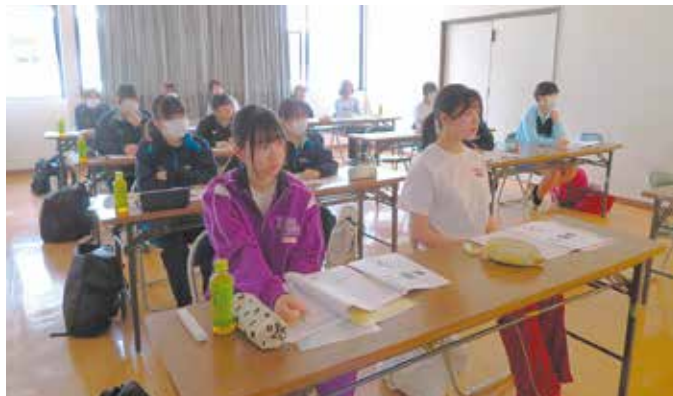
共同募金について学ぶ様子

市内在住・在学の中高生13名が参加し、地域の中の支え合いの仕組みの一つである共同募金について学んだ後、その募金を活用したボッチャの体験イベント「みんなであそボッチャ」に、運営ボランティアとして携わりました。障がいの有無に関わらず、小学生から高齢の方まで、計20名の方にご参加いただき、ボッチャをとおして楽しい時間を過ごすことができました。