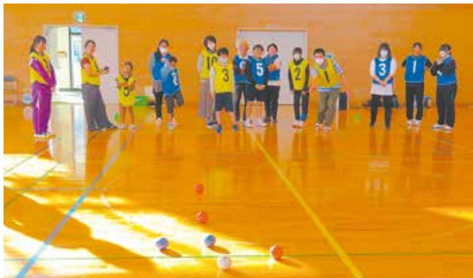
みんなであそボッチャの様子