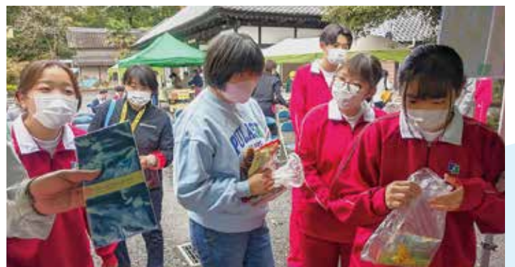
▼次はどこのお店を見ようか検討中…