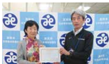
8. JAはが野 真岡地区二宮地区女性会(11月)