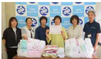
30. (一社)真岡法人会 真岡支部女性部