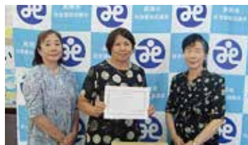
8. JAはが野 真岡地区二宮地区女性会(8月)