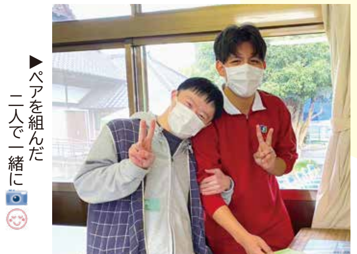
▶ペアを組んだ二人で一緒に