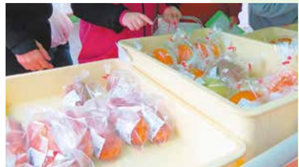
▲ご出店いただいた自家製パン