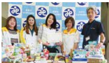
39. 明治安田生命 宇都宮支社真岡営業部