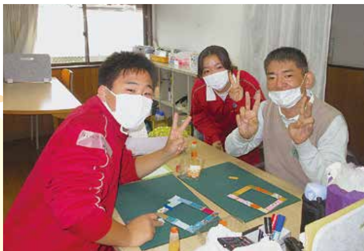
▲真岡北陵高校生と一緒に製作活動を行い、交流している様子